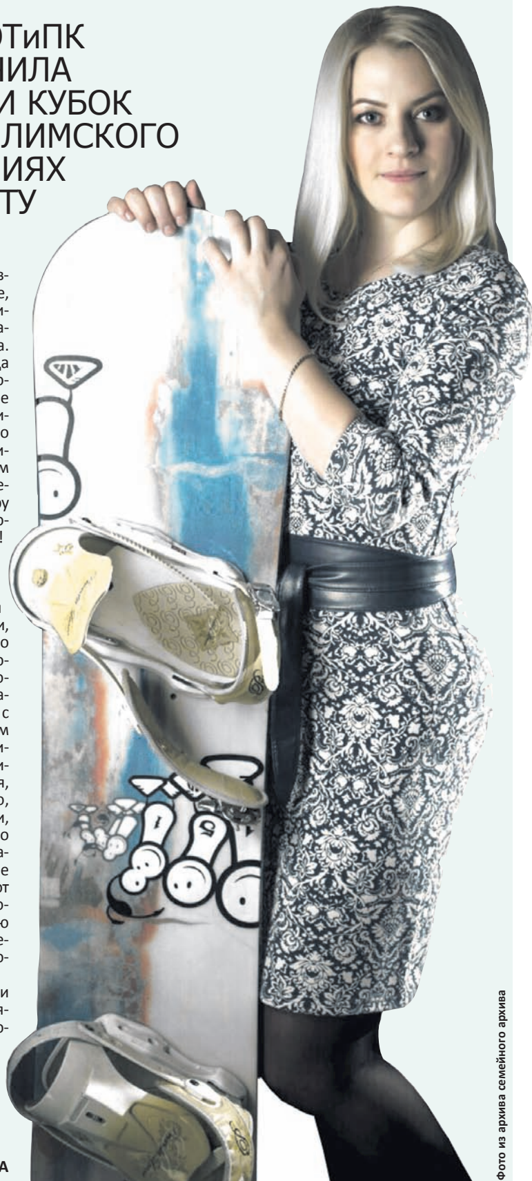
Фото из архива семейного архива