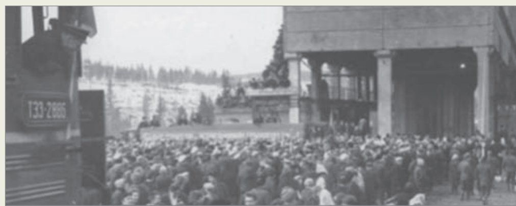
У погрузочной эстакады, откуда отходил эшелон с концентратом, собрались тысячи людей