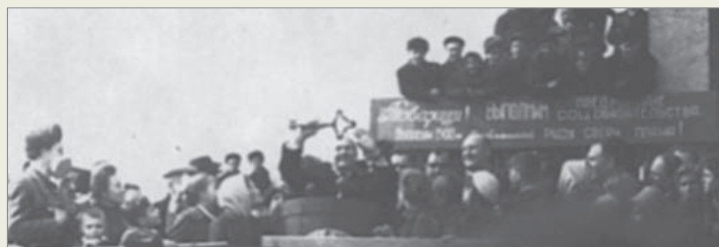
Ключ — символ надёжности и долговечности построенных сооружений

31 марта 1965 года Государственная комиссия подписала акт о вводе в эксплуатацию пускового комплекса первой очереди Коршуновского горно-обогатительного комбината с оценкой строительно-монтажных работ «хорошо». Так уж вышло, что сам день 31 марта не отмечен фотографиями. Поэтому самым ярким остаётся запечатлённый на архивных снимках день отправки в Новокузнецк первого эшелона с 2 тысячами тонн ЖРК и торжественный митинг с продолжившимися гуляниями в рабочем посёлке Железнодорожск.