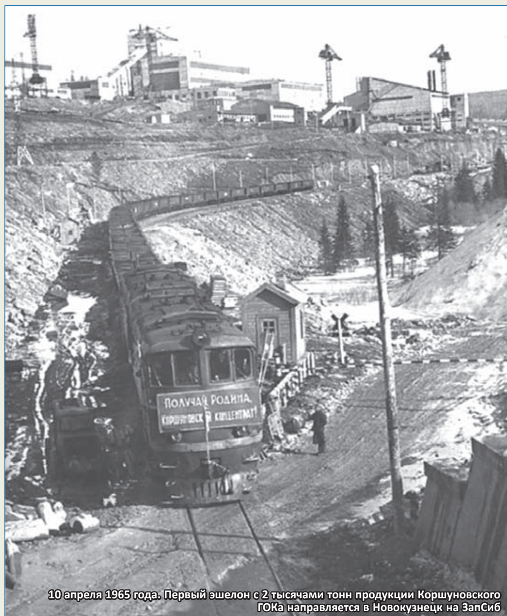
10 апреля 1965 года. Первый эшелон с 2 тысячами тонн продукции Коршуновского ГОКа направляется в Новокузнецк на ЗапСиб

СЕГОДНЯ МЫ ВСПОМИНАЕМ О СОБЫТИИ 55-ЛЕТНЕЙ ДАВНОСТИ, ВОШЕДШЕМ В ИСТОРИЮ КОРШУНОВСКОГО ГОКА, КАК ЕГО ДАТА РОЖДЕНИЯ