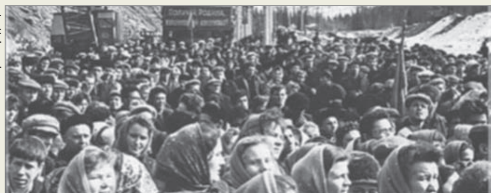
Митинг по поводу первой отгрузки концентрата